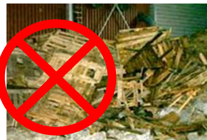
APPAパレット VS 木製パレット